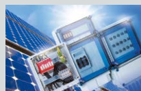
ENYSUN Normgerechte Photovoltaik-Verteiler