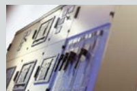
ENYPOWER Typgeprüfte Niederspannungs-Schaltanlagen bis 5000 A, IP 30-65

Gustav Hensel GmbH & Co. KG Elektroinstallations- u. Verteilungssysteme Gustav-Hensel-Str. 6 · D-57368 Lennestadt Telefon: 0 27 23/6 09-0 Telefax: 0 27 23/6 00 52 E-Mail: elektrotipp-pv@hensel-electric.de www.hensel-electric.de