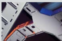
ENYTRAC KT-Kabelträger für große Stützabstände