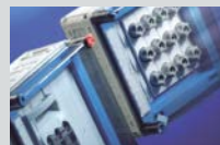
ENYMOD Mi-Energieverteiler bis 630 A IP 54-65