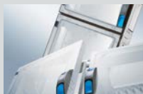
ENYSTAR Installationsverteiler bis 250 A mit Tür IP 65