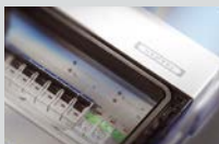
ENYBOARD KV-Kleinverteiler bis 63 A 3 bis 54 Teilungseinheiten, IP 54-65